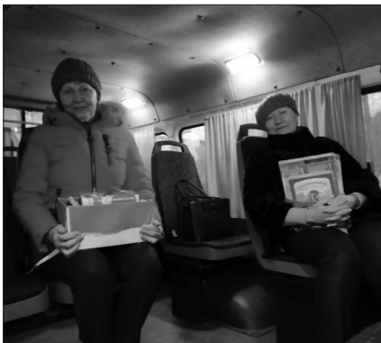
Работа библиобуса в выездных мероприятиях

Библиобус был задействован при проведении крупных районных мероприятий, таких как митинг у братской могилы «Июнь 41 года» и др.