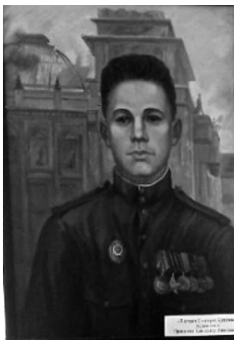
Портрет Григорий Булатова. Художник А. Н. Пронькин, г. Слободской, 2000 г.