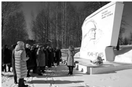
У отремонтированного памятника-обелиска воинам-нагорчанам

тыре героя Советского Союза (фотография и краткая биография) и три имени погибших в Афганистане и Чечне (фотография с краткой биографией). Оценить масштаб и качество проделанной работы смогли директора централизованных библиотечных систем Кировской области, посетившие Нагорск в рамках областного совещания директоров по итогам работы за 2020 год.