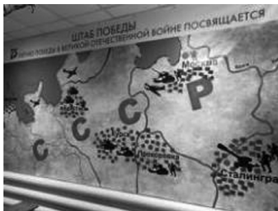
Проект «Штаб Победы»

но-патриотического воспитания Кировской области, Областной совет ветеранов. Среди победителей: