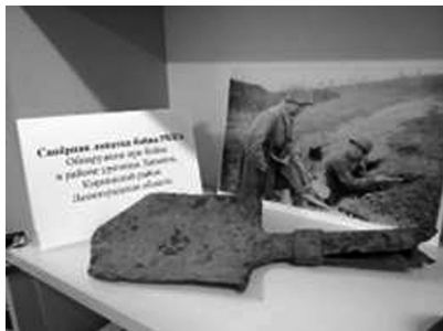
Выставка «Артефакты войны»