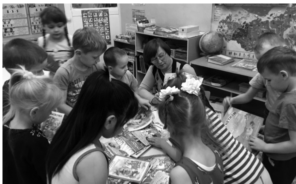
Работа библиобуса в выездных мероприятиях

зять, что наличие специализированного транспортного средства вещь необходимая, так как помогает осуществлять библиотечную деятельность, но очень дорогая. На содержание автомобиля и выполнение всех требований ФЗ № 196 необходимы большие финансовые затраты, которые дополнительно из бюджета района не выделяются, поэтому приходится изыскивать из скудного бюджета библиотеки. Расход на содержание библиобуса за год составил 303 500 руб., с учетом заработной платы водителя.