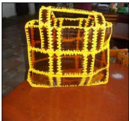
Поделка «Продуктовая сумка»