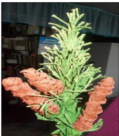
Поделка «Сосновая ветка с шишками»