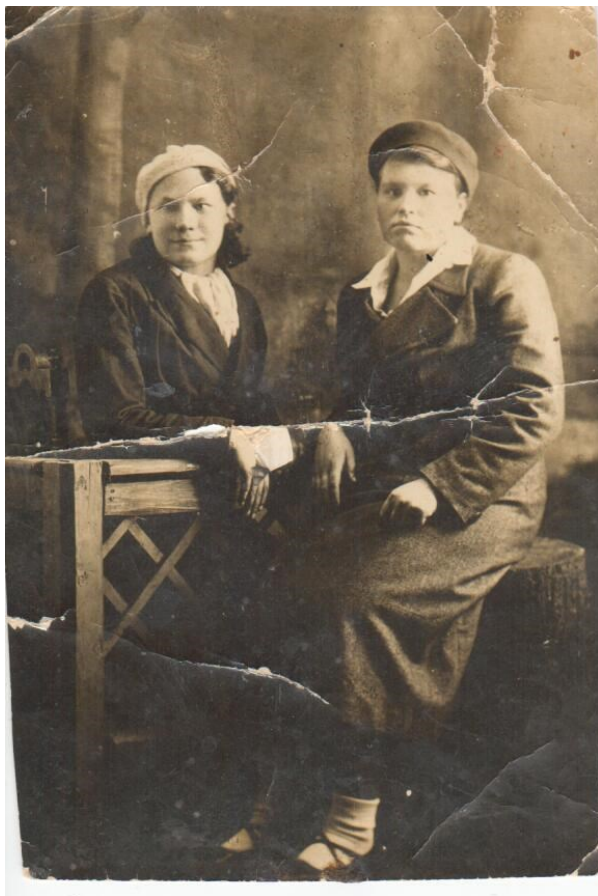
Фото мая 1941г.