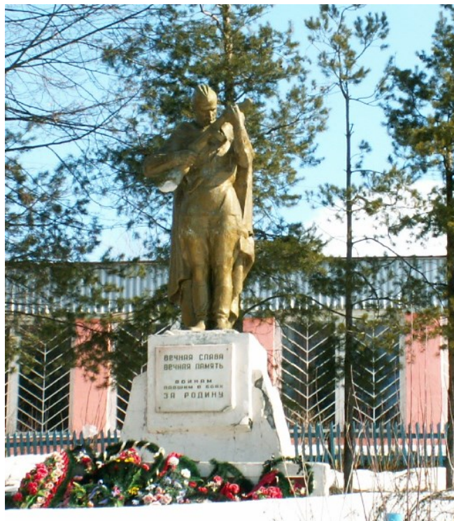
Памятник воинам-землякам погибшим в годы Великой Отечественной войны в п. Суна

Кто говорит, что на войне не страшно, Тот ничего не знает о войне. Ю. Друнина