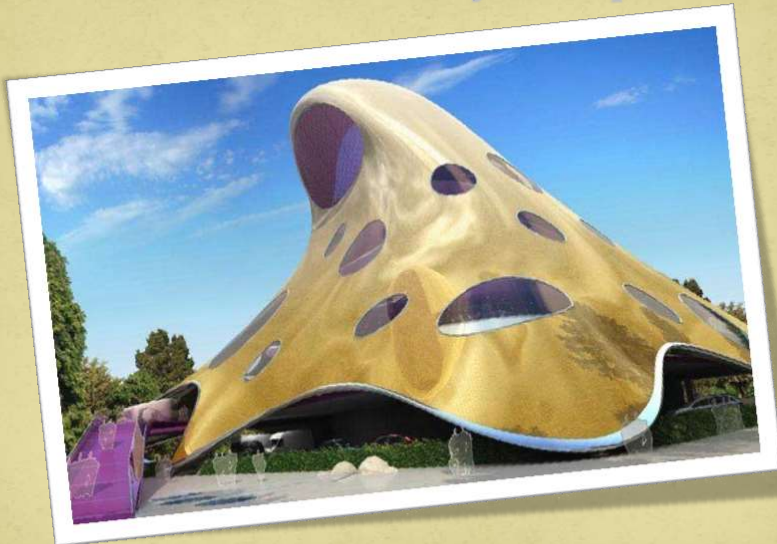
Национальная библиотека Чехии.