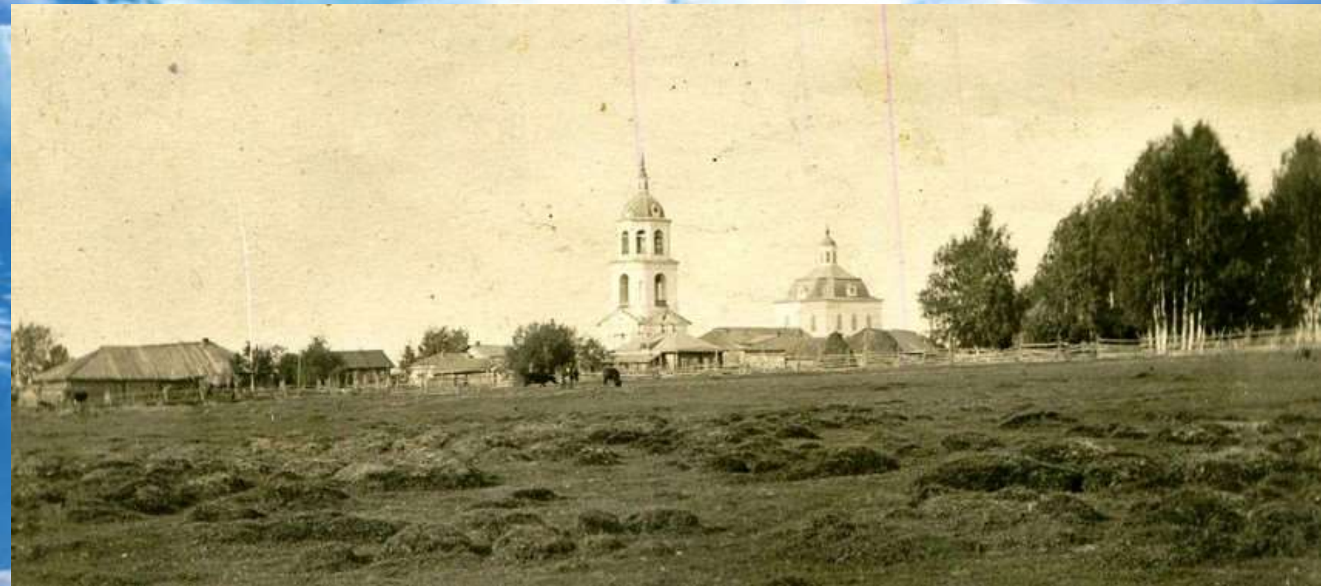
Колково. Церковь Илии Пророка