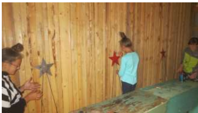
Покраска «Звёзд памяти» волонтерами

По воинским захоронениям, чьи родственники не найдены, решение пока не принято. В поисках спонсоров. Стоимость «Звезды Памяти» с покраской и изготовлением таблички – 280 руб