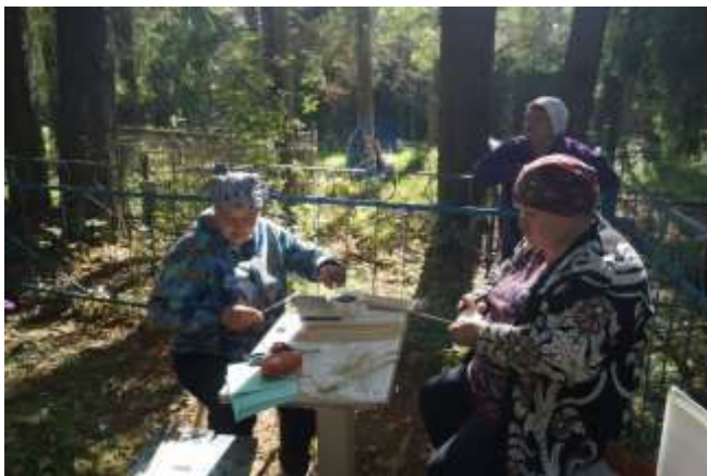
Представители Совета ветеранов в один из дней проведения инвентаризации на Среднеивкинском кладбище