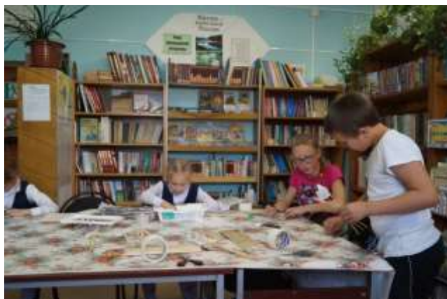
Обучающиеся Среднеивкинской средней школы за изготовлением флажков для проведения инвентаризации.