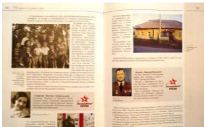
Разворот книги с рубрикой «Бессмертный полк»

В связи с эпидемиологической обстановкой в стране, работа весной приостанавливалась – встречи с пожилыми родственниками были отменены.