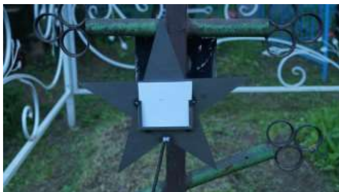
Пробный вариант «Звезды памяти»

В сельской библиотеке начали сбор информации о солдатах. Собрано уже более 130 историй, многие из них никогда бы не стали известны, если бы не эта акция.