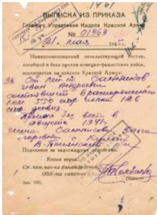
Выписка из приказа