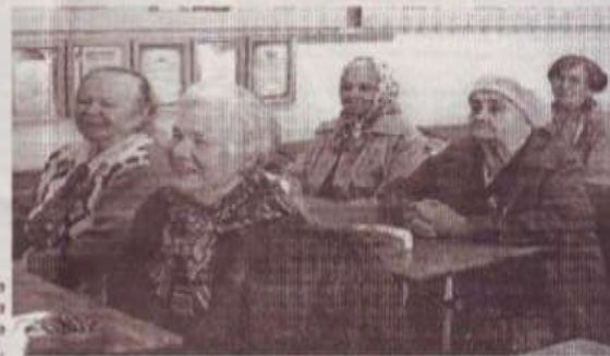
На уроке мужества в школе №2.