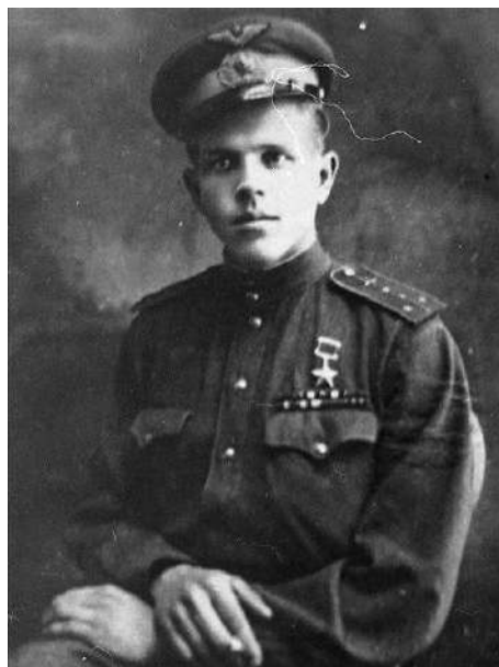
Герой Советского Союза Россохин Борис Гаврилович