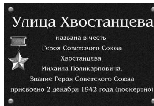
Мемориальная доска на улице Хвостанцева в посёлке Юрья Кировской области