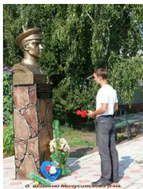
Бюст героя в деревне Шошино Минусинского района Красноярского края