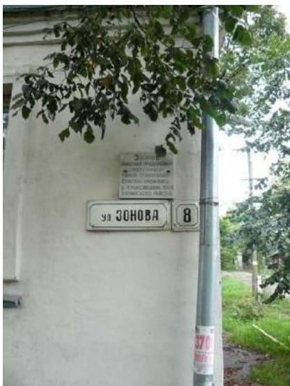
Мемориальная доска Зонову Н. Ф. в городе Орлове Кировской области