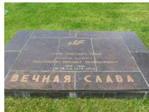
Мемориальная плита на Мамаевом кургане