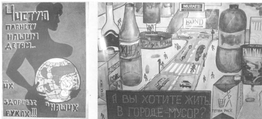
Работа студентов Восточно-Сибирского института туризма

данным, доля Красноярского края (без Эвенкии и Таймыра) от производимых в России отходов составляет 14% - это 250 млн. тонн отходов ежегодно. Ещё несколько лет назад было 150 млн. тонн. Общая площадь земель, занятых под места размещения отходов, составляет 1,58 тыс. гектаров. Только на долю Красноярска приходится 50,8% от общего объема образующихся в крае твердых бытовых отходов, 30% из них — бытовые. Разлагаясь, они отравляют воздух, почву, подземные воды и превращаются в серьезную опасность для окружающей среды и здоровья людей - нынешних жителей страны и будущих поколений. Количество бытовых отходов неуклонно возрастает из-за потребительского отношения к природным ресурсам и изменения образа жизни: