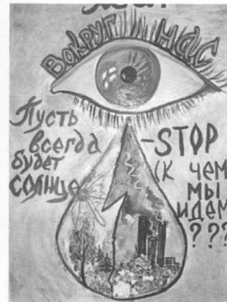
Работа студентов медицинского колледжа — победителей конкурса

Конкурс экологических рисунков и плакатов «Отходы и стиль жизни»