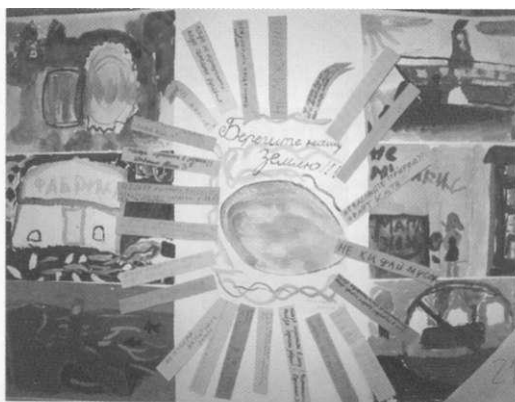
Коллективная работа учащихся 2-го класса школы №76

желания наслаждаться жизнью сейчас, не задумываясь о будущем, использования большого количества товаров, и соответственно, упаковки, одноразовой посуды и т.д. Привычка мусорить и выбрасывать отходы повсюду, где удобно, — это неизбежный результат несформированного экологического сознания, низкой культуры населения. И пока порядком правит умопомрачающая всеобщая страсть к