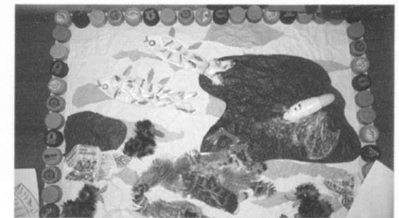
Коллаж из бытовых отходов. Работа учащихся школы №76