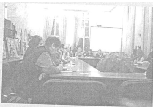
Заседание круглого стола «За чистоту родного города: как изменить «мусорную» психологию горожан»

На круглом столе обсуждались острые, злободневные вопросы утилизации мусора, юридической ответственности граждан за загрязнение мест обитания, вопросы всеобщего воспитания экологической культуры и изменения «мусорного» сознания россиян. Присутствующие узнали,