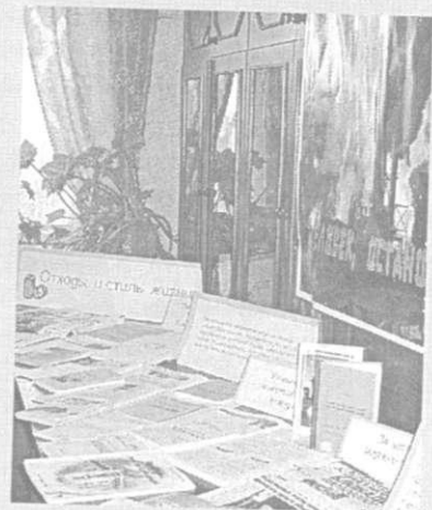
Информационная составляющая круглого стола — выставки

что делает управление по охране окружающей среды Красноярска для улучшения экологической обстановки в городе, куда можно сдавать макулатуру, пластик и стекло для переработки и вторичного использования, и к какому выводу склоняются психологи о воспитании «экологичного» человека. Все присутствующие сошлись во мнении, что переломить сложившуюся ситуацию можно, но для этого необходимо приложить усилия с разных «фронтов», то есть заниматься экологическим просвещением населения должны все — семья, школа, природоохранные организации, библиотеки и СМ И. Также вниманию участников круглого стола была представлена выставка литературы, посвященная ситуации с бытовыми отходами в других странах и методам переработки мусора, а также экспозиция «Вторая жизнь отходов» из «ненужных» материалов (стекло, фантики, обертки от фруктов и прочее) и природного сырья. На участие в экспозиции откликнулись не только детские дома творчества, но и авторитетные авторы, хорошо известные в творческой среде Красноярска.