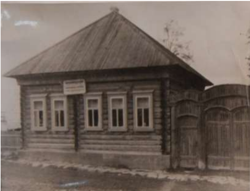
Контора Ильинской кружевной артели в 1937 году

В 1898 году в селе Ильинском открылась кружевная артель