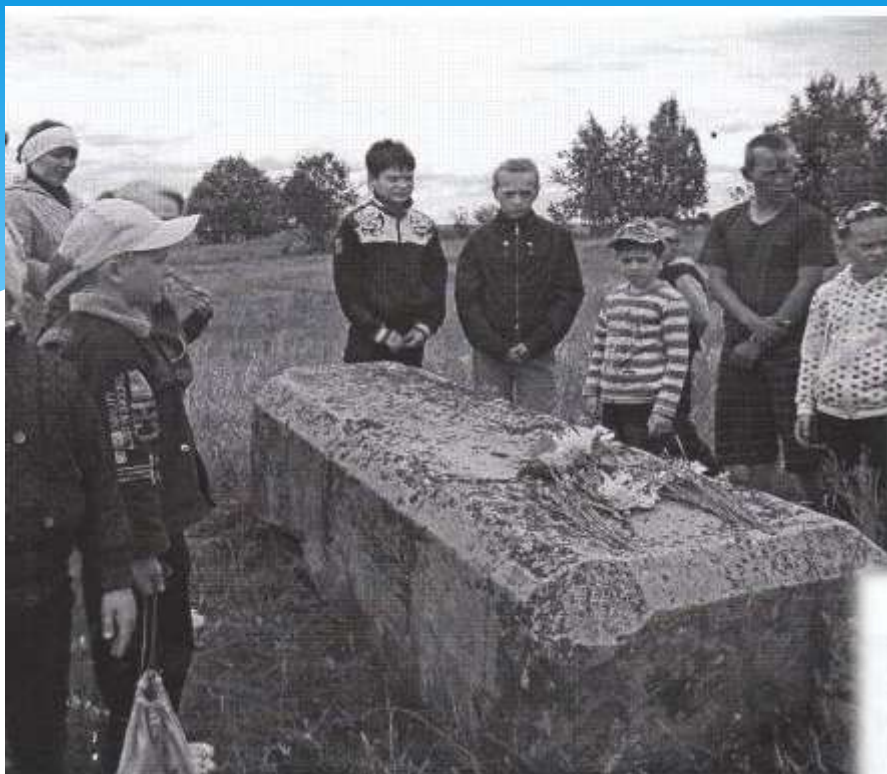
памятное место Марии Убиенной