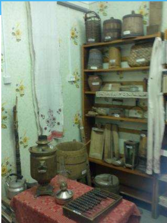
Ильинская сельская библиотека