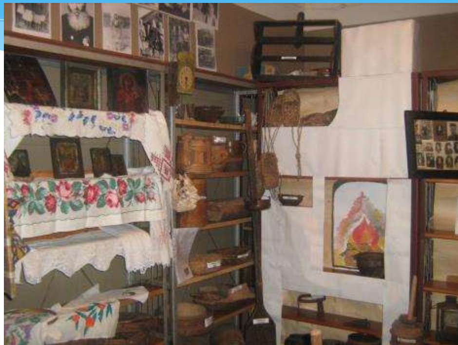
Кожинская сельская библиотека